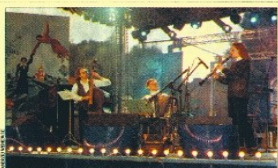
Di Galitzyaner Klezmerim podczas obchodzonego Festiwalu Kultury Żydowskiej